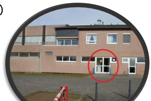
Eingang zur Halle D (Dojo)

Im Anschluss an den Kurs besteht die Möglichkeit Mitglied im Karate-Verein Wenden zu werden.