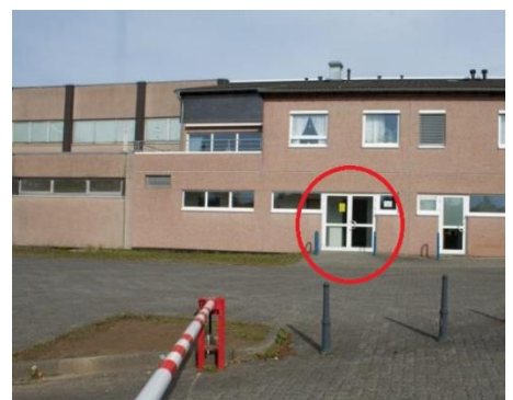
Eingang zur Halle D (Dojo)

!! Die Teilnehmerzahl ist auf max. 16 Teilnehmer beschränkt !!